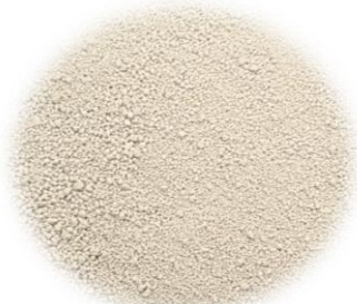
Color: Beige Claro

Materia prima para piensos según Reg. (UE) Nº 68/2013 Catálogo de materias primas para piensos.